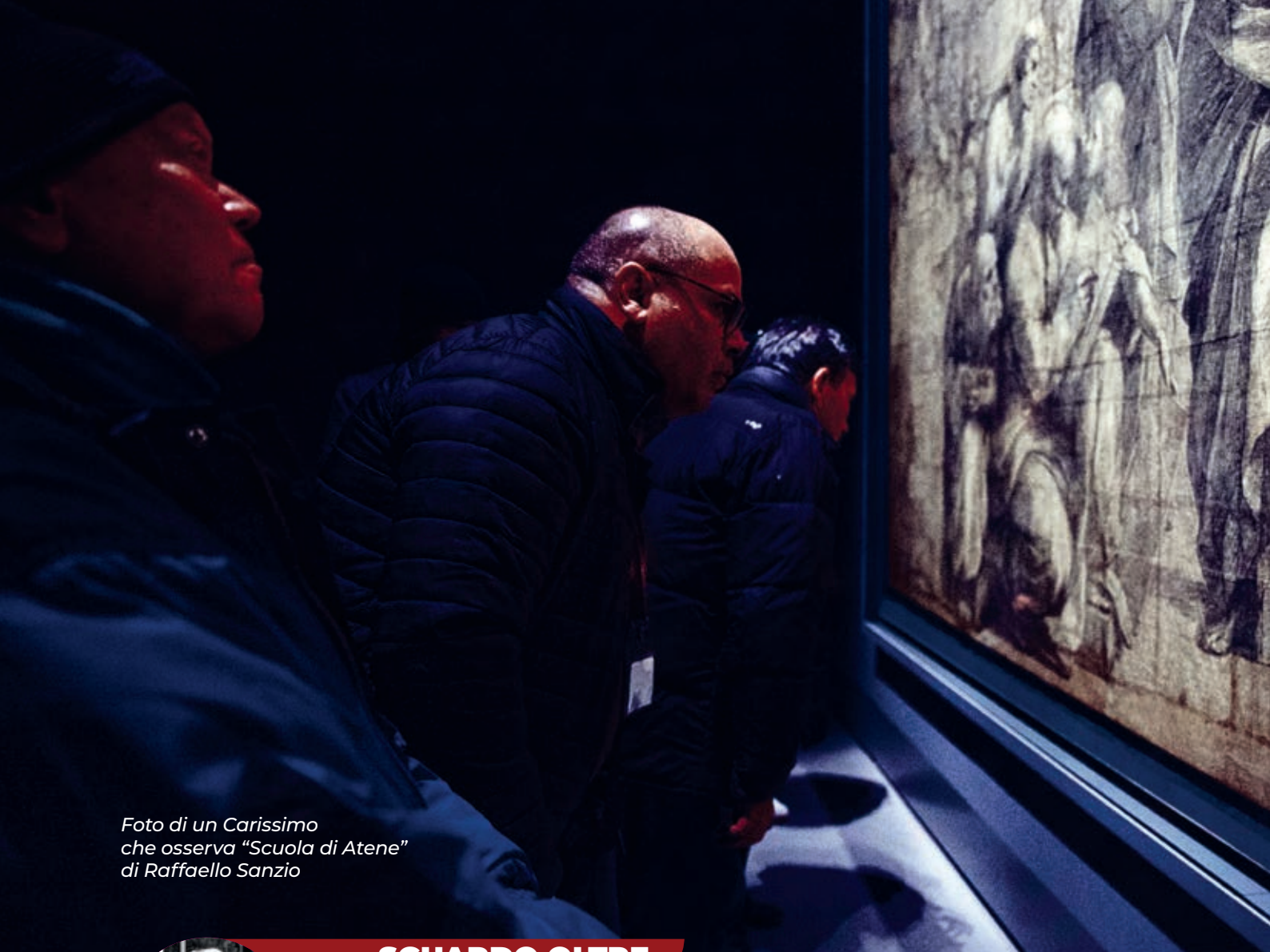
Foto di un Carissimo che osserva "Scuola di Atene" di Raffaello Sanzio